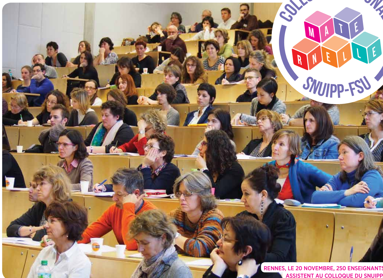
RENNES, LE 20 NOVEMBRE, 250 ENSEIGNANTS ASSISTENT AU COLLOQUE DU SNUIPP.

Aujourd'hui, il est temps de redonner à la maternelle de la sérénité, une identité, un cap et des moyens. Après avoir été bousculée sur ses bases, remise en cause y compris par des ministres adeptes des coups de « couches culottes », soumise à des injonctions paradoxales qui ont conduit à une « prima-ri-sation » contreproductive notamment vis-à-vis des élèves les plus fragiles, une nouvelle séquence s'ouvre. La maternelle sera cadrée par un cycle unique et de nouveaux programmes sur lesquels les enseignants ont été consultés sont en cours de finalisation. Ce sont des signes positifs mais on ne change pas l'école à coup de lois et de circulaires. Il faut aussi donner aux